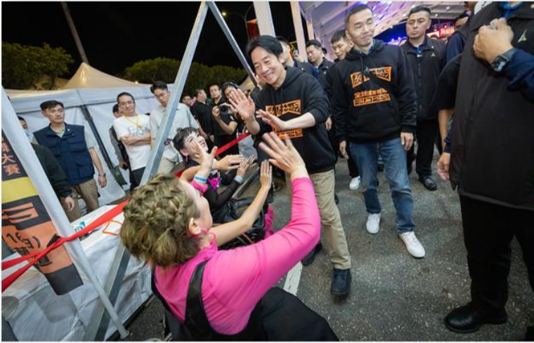
賴清德總統今（16）日晚間出席「2025總統盃全民運動賽事－街舞大賽」決賽暨頒獎典禮