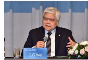
台積電為反壟斷與關稅壁壘做準備，晶圓製造 2.0 成市場焦點

第二，從公平會的年報可以發現，這幾年來，關切台灣市場競爭狀況的民眾越來越多，檢舉案件數自2011年到2023年，增加50%到60%，主要都是跟民生相關的議題，也就是零售批發業，2011年的時候佔比27%，到2023年的時候達到49%，所以這個事情會變成不是只有臺灣的大企業需要重視競爭法，台灣的民眾也很關切自己日常生活當中的相關市場是不是面對公平競爭。然而，目前公平會的職員數卻是呈現下降趨勢，如果大家希望公平會提高執法效率，就應當給予足夠的人力、預算、資源，尤其是數位賦能，國際上處理數位跟AI在競爭法的議題，其實非常強調怎麼導入數位跟數據分析的工具，然後這些工具其實是在協助這些執法機關進行事前偵測、風險評估及輔助調查，但是這些事情基本上需要人也需要經費，請問您將如何解決目前公平會當今面臨的業務越來越多、人力越來越少的困境？